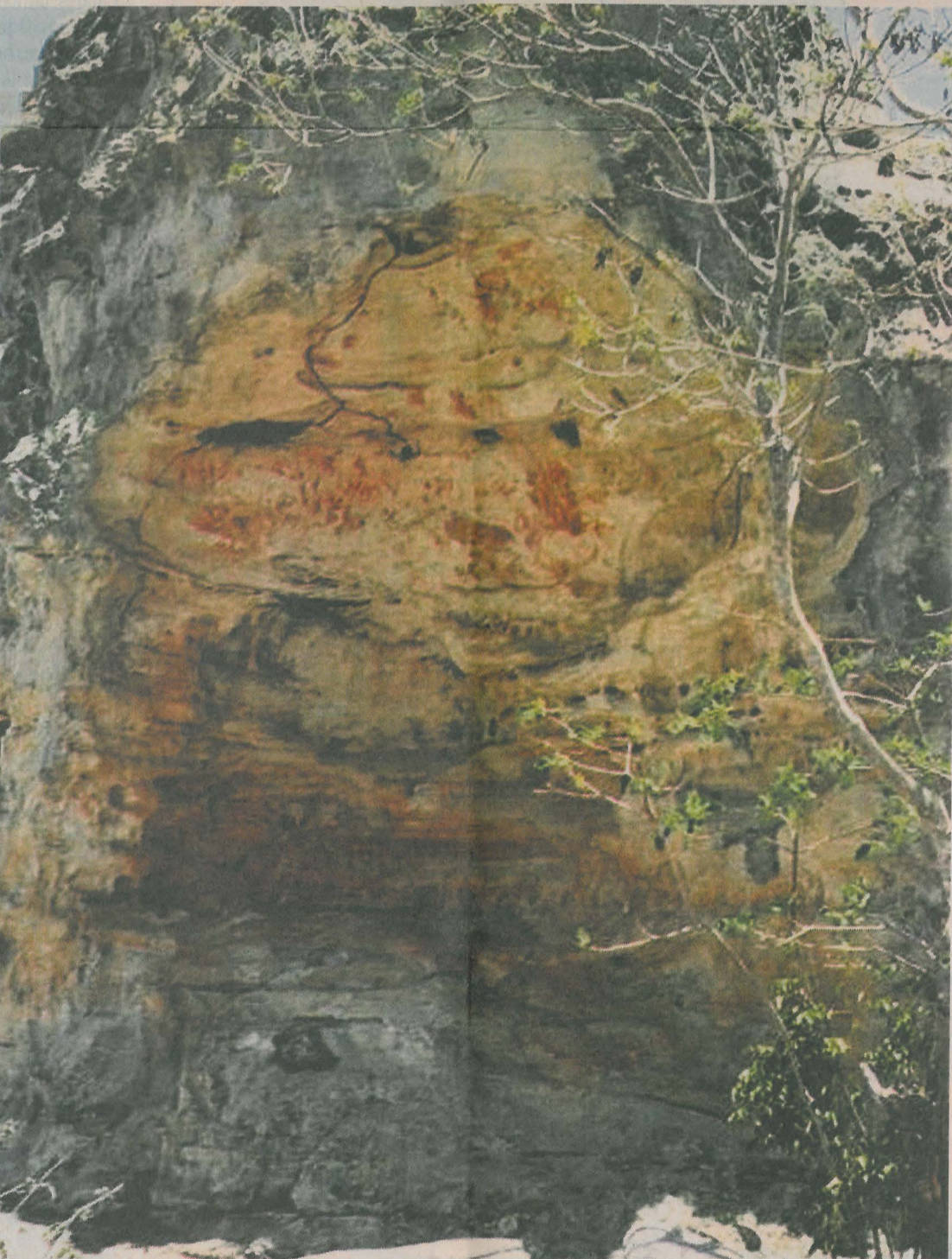
AÇÃO CRIMINOSA Figuras rupestres do Parque Nacional do Catimbau, em Buíque, Agreste, revelam costumes de grupos étnicos que habitavam a região e foram danificadas. Polícia não identificou responsáveis pelo vandalismo